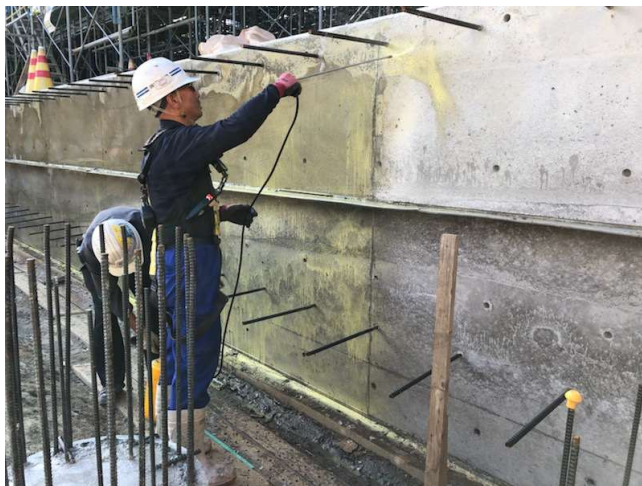
底盤コンクリートへ 150ml/m 2 塗布