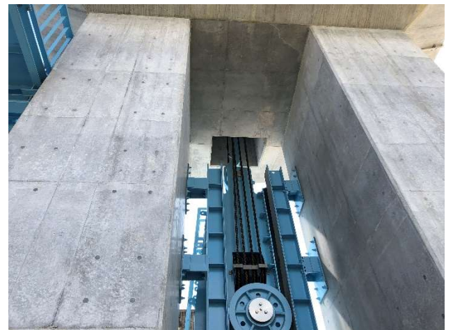
塗布 1 年後