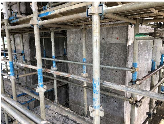
堰柱コンクリート SoyShot-20 塗布 4 日後